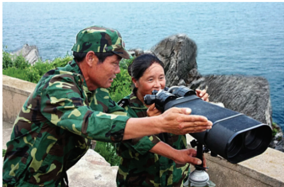
守岛卫国32年的王继才夫妇

新年贺词几乎句句话不离人民。谈及2018年,习近平提到“各项民生事业加快发展,人民生活持续改善”。谈到脱贫攻坚,他高兴地说,全国又有125个贫困县通过验收脱贫,1000万农村贫困人口摆脱贫困。他还牵挂扶贫干部:我时常牵挂着奋战在脱贫一线的同志们,280多万驻村干部、第一书记,工作很投入、很给力,一定要保重身体。不止始终惦记着困难群众,他还关心“追梦人”。他说,我注意到,今年,恢复高考后的第一批大学生大多已经退休,大批“00后”进入高校校园。他还特别提到一些闪亮的名字:“天眼”总工程师南仁东,全军英模林俊德和张超,守岛卫国32年的王继才,为保护试验平台挺身而出、壮烈牺牲的黄群、宋月才、姜开斌。“他们是新时代最可爱的人,永远值得我们怀念和学习。”