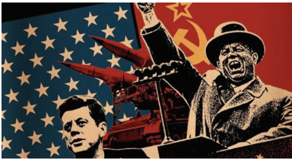
冷战期间美国的政治宣传画

2018年7月，教育部印发《关于开展幼儿园“小学化”专项治理工作的通知》，针对一些幼儿园违背幼儿身心发展规律和认知特点，提前教授小学内容、强化知识技能训练的“小学化”倾向提出了以下几项治理任务：1.严禁教授小学课程内容。2.纠正“小学化”教育方式。3.整治“小学化”教育环境。4.解决教师资质能力不合格问题。5.小学坚持零起点教学。