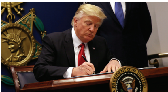
特朗普的对外政策

由于特朗普本人事事风格的不羁善变及其领导班子尚未到齐，我们尚无法对特朗普的外交政策进行准确的预测。但根据特朗普本人的特点及其上任以来的行为，我们还是可以来分析特朗普对外政策的特点，并对中美关系的未来进行展望。