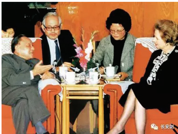
资料图:邓小平与撒切尔夫人

邓小平9天之内参加80多场活动,参加了约20场宴请或招待会,是新中国成立以来,中国领导人第一次访美,堪称“破冰之旅”。合则两利。中美双方友好互利合作是两国人民的共同愿望,也是时代的潮流和要求。此次访美,进一步增进了中美双方互信,为改革开放打开了窗口,推开了两国关系正常化的大门,是两国关系史上的里程碑,也在现代国际关系史上写下了浓墨重彩的一笔。