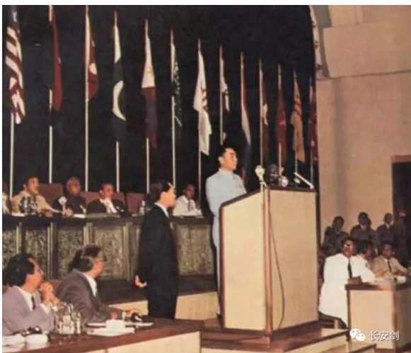
资料图：周恩来在万隆会议上