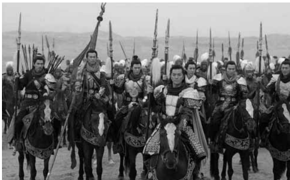
后世影视作品中的杨家将形象 资料图

核心提示: 杨家将的威名实际上只维持了三代而已,在北宋灭亡前,就已实力不在。杨业,杨延昭,杨文广,这三个人是历史中杨家将的主要人物。杨家将三代血战报国的事迹,为后人所传扬。尤其是杨业和杨延昭,在北宋时期,已经天下闻名。杨文广死后,此后大约有三代人没有什么大出息。这时大多数人已搬出天波杨府。作为一个贵族府第他们已没有资格居住,因为他们只是充当一般的下级军官。据说到了宋徽宗初年,杨家将已完全衰落下去了。