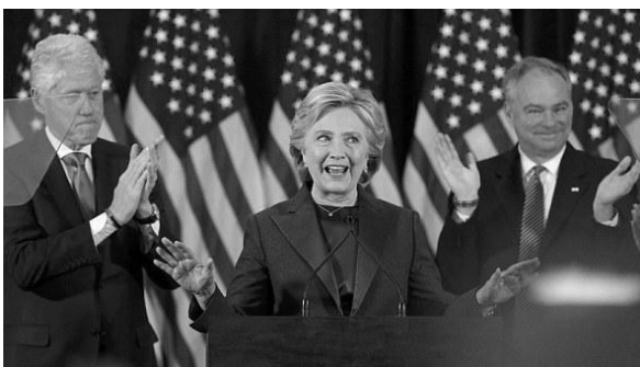
希拉里发表败选演讲

特朗普在11月8日美国大选中获得了第45任美国总统职位入主白宫。本周三（11月9日）大选失败的希拉里及其竞选团队举行了迟到的“承认失败”演讲。