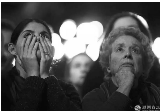
希拉里支持者们悲伤的表情