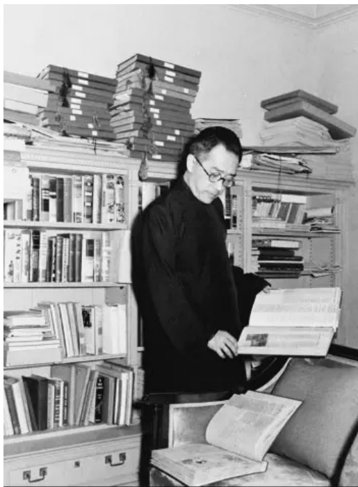
▲1941年胡适在出任驻美大使期间做书刊剪报

年冬，我在广西开始研究太平天国史，便是得到我父亲的书才能工作的，但到1934年春重来北平时，在胡适家中要继续研究，却一本都没有。从我所经历的情况，具体地说明了胡适文史书籍的缺乏。1923年3月，胡适应清华即将留学的几位学生之请，开了《一个最低限度的国学书目》，列有《九命奇冤》小说，而没有《资治通鉴》。梁启超见了，以为“岂非笑话”。梁启超还不知道在胡适的藏书