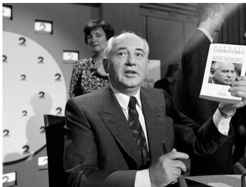
戈尔巴乔夫在推销自己的回忆录

戈尔巴乔夫曾经想要复出政坛,但极不顺利,于是转而投身环保事业,发起成立了“戈尔巴乔夫基金会”和“国际绿十字会”等组织。戈尔巴乔夫拍电影、拍广告等活动的收入,相当一部分都被投入到了环保等公益活动之中。显然,他试图以这种方式,在政治以外证明自己的能力与价值。