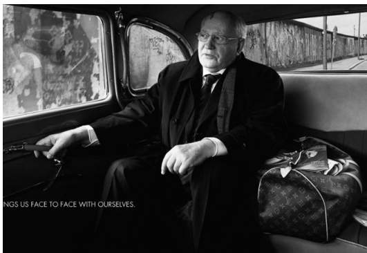
戈尔巴乔夫为LV拍摄的广告

总结戈尔巴乔夫的出镜情况,不难发现几个特点,首先是表明一种对出演内容的赞同或喜欢;其次是为给环保等公益事业筹款“献身”;第三,由于卢布贬值,戈氏原本不多的退休金更是大幅缩水,不得不频繁出镜,赚一份辛苦钱。