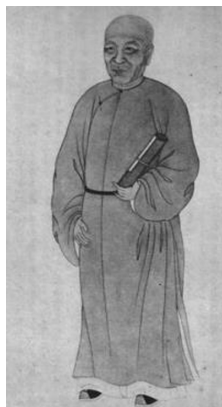
云南总督张允随。

正当杨锡绂加强关隘防守力量时,1743年5月,杨锡绂发现,从中国内地涌入的民众莫武康、李三聪等人当了安南国内叛乱分子的先锋官。他将这一情况报告给乾隆帝,后者要求安南国王不要顾忌,尽力擒捕。以后“凡系内地民人在安南滋事者,立即送出”,再次告诫杨锡绂“实力”防守隘口,防止内地百姓流入安南国内捣乱。