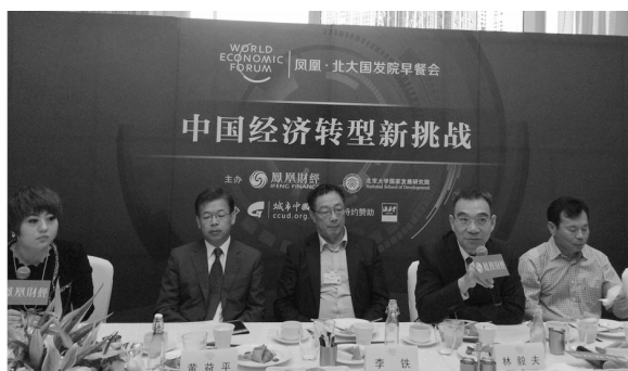
凤凰早餐会现场林毅夫发言

9月9日-11日，夏季达沃斯论坛在大连举行，主题为“描绘增长新蓝图”，凤凰财经再次强势出击全面参与夏季达沃斯的报道。10日，凤凰财经与北京大学国家发展研究院共同举办早餐会，林毅夫、黄益平等嘉宾出席，主要探讨了中国经济现状、中国经济转型、东北经济困境、国有企业改革等议题。