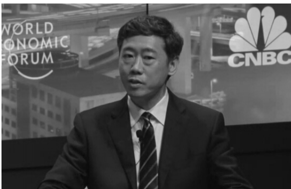
清华大学苏世民学者项目主任李稻葵