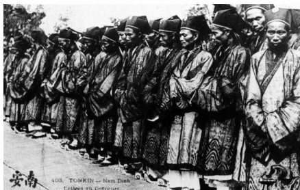
古越南官员。

对此也有一套处理办法。以琉球为例,当琉球渔民不慎随风浪漂流至中国沿海时,地方官先查明身份,得知是属国百姓时,会先上报上级,将他们在福建驿馆安顿好,送来米、盐菜银、衣服、被褥等等,此谓之“恤”。还有“赏”,包括蓝布、棉花、茶叶、生烟、面、肉等等,临走前,地方官还会把船只修好,帮助变卖船上携带的货物,让难民有钱有物有东西吃,安全回国。乾隆帝说,这样做才“不为外夷所轻”,才是“怀柔远人之道”。④