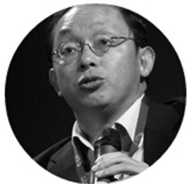
中国宽带资本董事长正和岛岛邻

田溯宁：我们今天看待大数据要从历史角度来看，人类文明进步与大发现有关系，我们可能到了一个新的大发现时代，就是像人类过去发现新大陆、矿物质、抗菌素一样到了一个数据大发现时代。我们只有用历史眼光才能理解在这个时代的很多困惑、很多激动人心的东西也有很多不解。