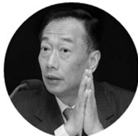
富士康科技集团创办人兼总裁

郭台铭：我想针对富士康集团如何从一个制造业转型为“六流公司”与各位做个分享。我所谓讲的“六流”其实是在大数据产业中一个关键的信息处理技术，大数据咨询处理过程中蕴含着信息流、技术流与资金流，此为三虚。以及人员流、物料流以及过程流，此为三实。