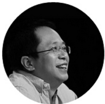
奇虎 360 董事长

周鸿祎:真正的大数据时代我觉得刚刚开始。我们现在觉得当互联网从 PC 互联网到手机互联网产生了数据,量有了飞速的增长,实际上现在“互联网+”中间有一个非常重要的趋势,就是 IOT,也就是我们所说的万物互联。