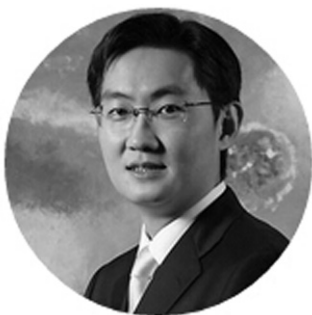
腾讯公司董事会主席兼首席执行官

马化腾：今天的主题是“互联网+”大数据，这个词在最近热度空前，有的媒体说这个概念最早是由我提起的，但是我跟大家透露，其实这个词最早是在2013年当时和阿里巴巴共同投资第一家互联网保险公司中安保险的时候，在上海发布会上我们提起的。之后在很多场合我也提起这个概念。