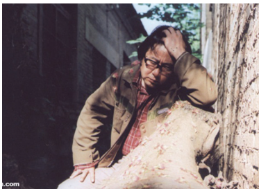
创作《平凡的世界》六年间,路遥每天要抽两包多“红塔山”。