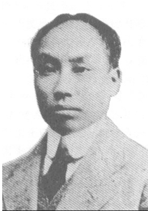
被称为“理想主义者”的第一代共产党人 陈独秀