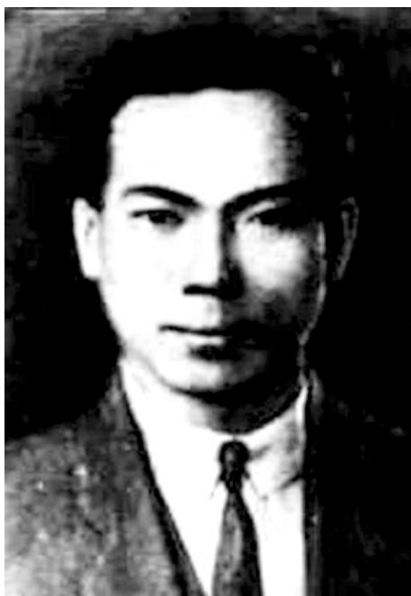
保守党的秘密， 陈延年 视死如归