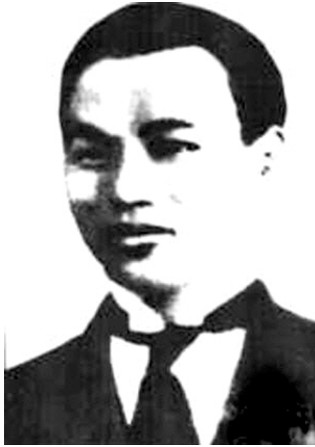
陈乔年牺牲时年仅 26 岁